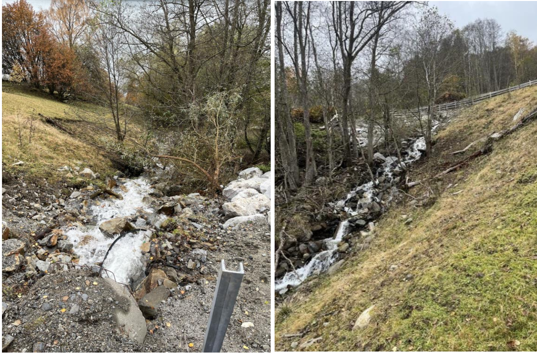
Bilde 3: Utløp av bekkelukking over gårds plass Bjørgevegen 222 Foto: NVE 16.10.24