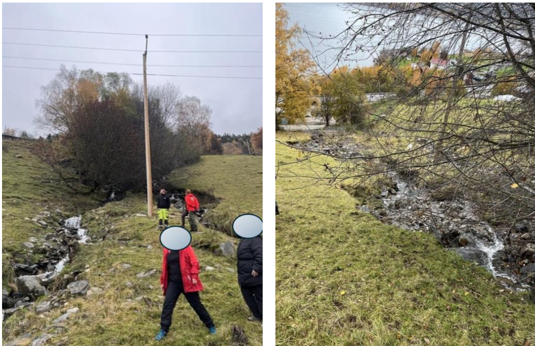
Bilde 4: Viser bekk har tatt nytt løp. 16.10.24