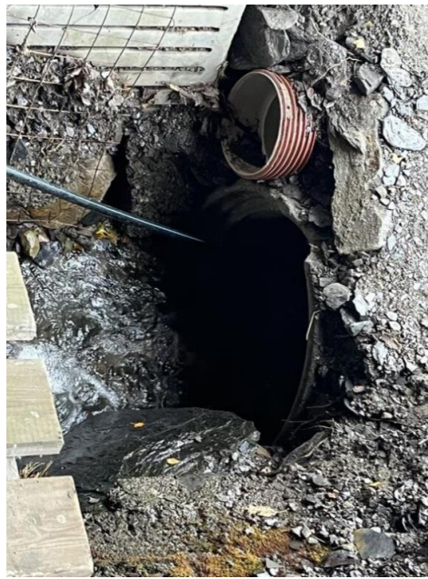
Bilde 2: Innløp og kryssing av bekk mellom to bygninger Foto: NVE 16.10.24