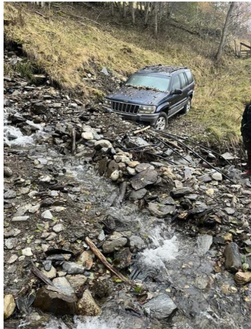
Bilde 1: Kryssing av skogsbilveg Foto: NVE 16.10.24