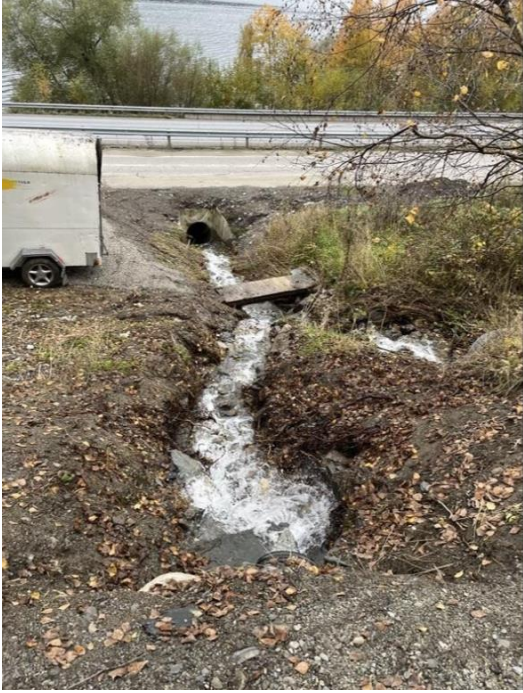
Bilde 5: Samløpet nedstrøms før bekken går i lukket rør under vegen. 16.10.24