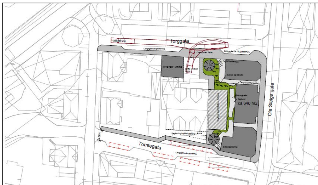
Illustrasjonar frå skisseprosjekt som eit innspel til ny sentrumsplan som no er under utarbeiding. Frå skisseprosjekt Nordplan, 2021