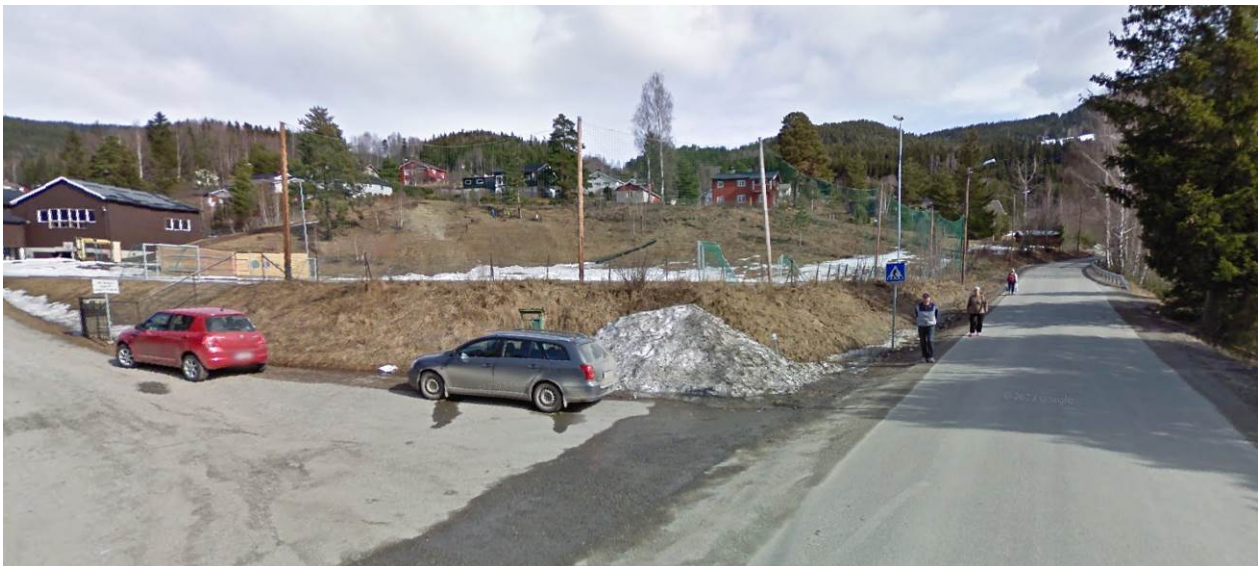
Fåvangvegen, FV 375, forbi Fåvang skole.