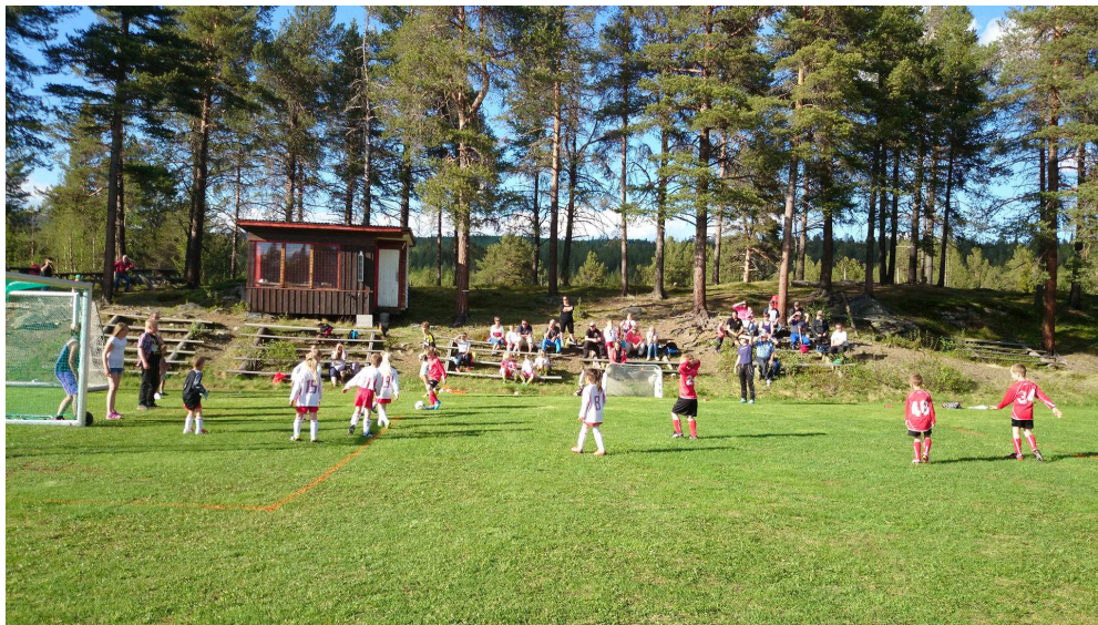
Stor fotballaktivitet på Kverndokka i Tverrbygda

Prioritert utbyggingsprogram/prioritering av spelemiddelsøknader følgjer som vedlegg.