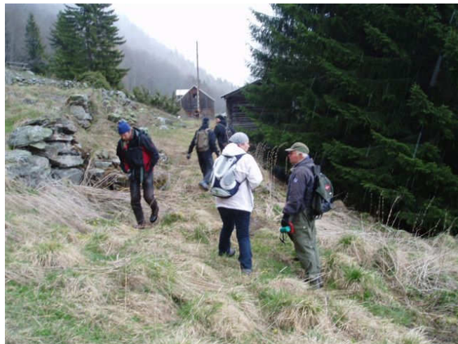
På tur langs Pilegrimsleia ved Skar på grensa mellom Sør- og Nord-Fron

Det bør prioriterast som regionalt tiltak å vedlikehalde enkelte av dei mest brukte turstiane som går innom meir enn ein kommune.