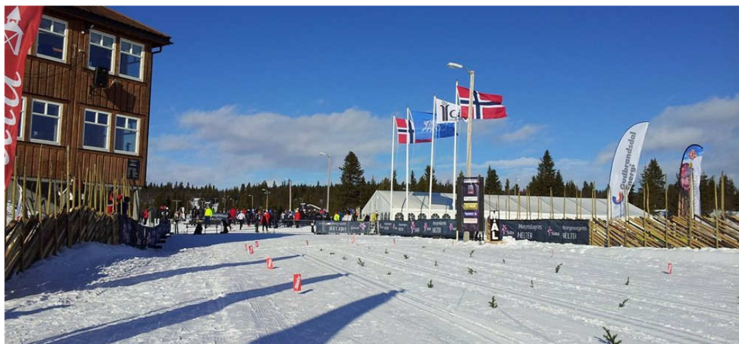
Gålå idrettsanlegg og skistadion er eit regionalt anlegg og arrangerte NM vinteren 2014