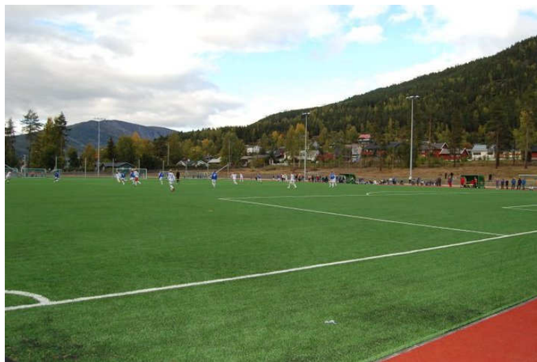
Kunstgrasbanen i Kåja på Vinstra