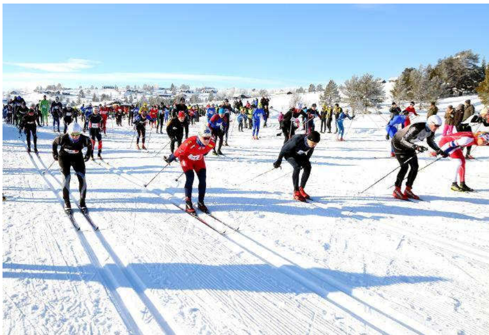
Frå Furusjøen rundt på ski