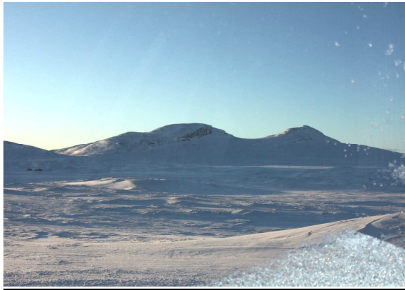
Fint skitereng på Venabygdsfjellet

Det offentlege bør auke støtta til oppkjøring av skiløyper samstundes som ein etablerer frivillig støtte frå brukarane. Ein bør få til ei mest mogleg lik haldning på dette området i dei tre kommunane.