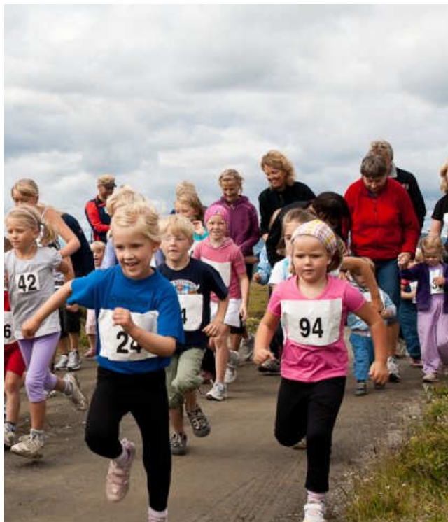
Stor innsats og idrettsglede. Frå Fagerhøyløpet