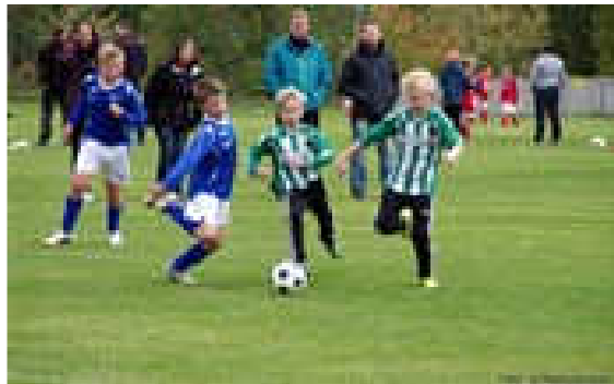
Stor fotballaktivitet i Ringeby