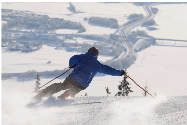
Alpinanlegget i Kvitfjell er vel det mest kjente idrettsanlegget i Midtdalen med årlege World-cup konkurranser i utfor og super-G.