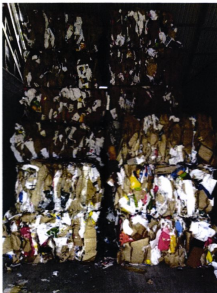
Pressa bunter med papp