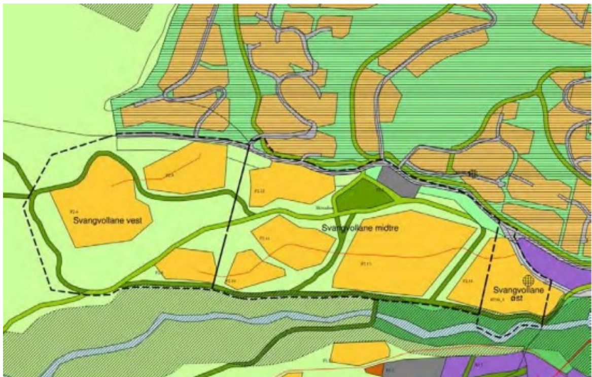
Figur 2: Svangvollaneplanene med kommunedelplanen i bakgrunn.